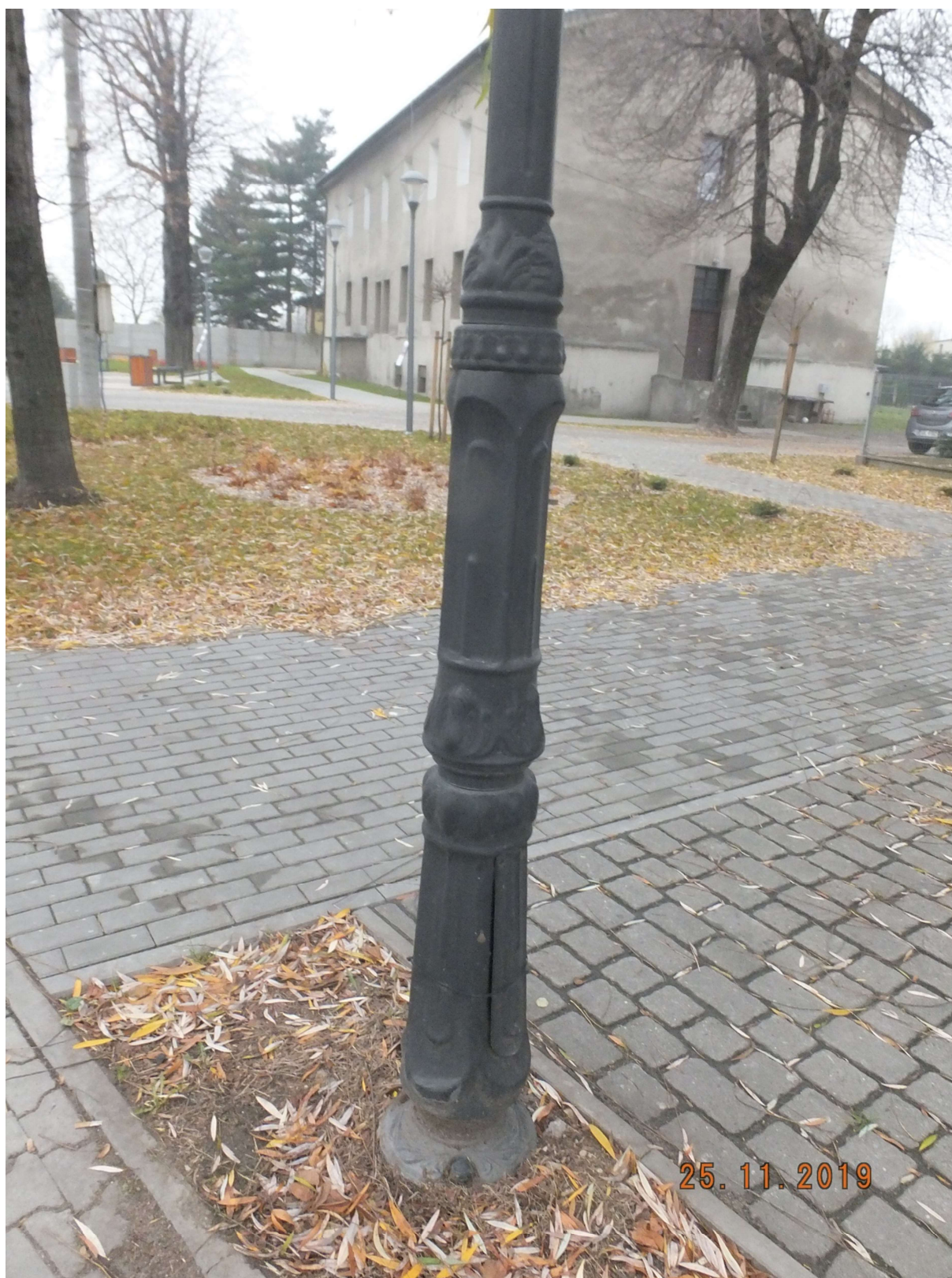
RYСУNEK 1 SŁUP OŚWIETLENIOWY PRZY ULICY WAWELSKIEJ