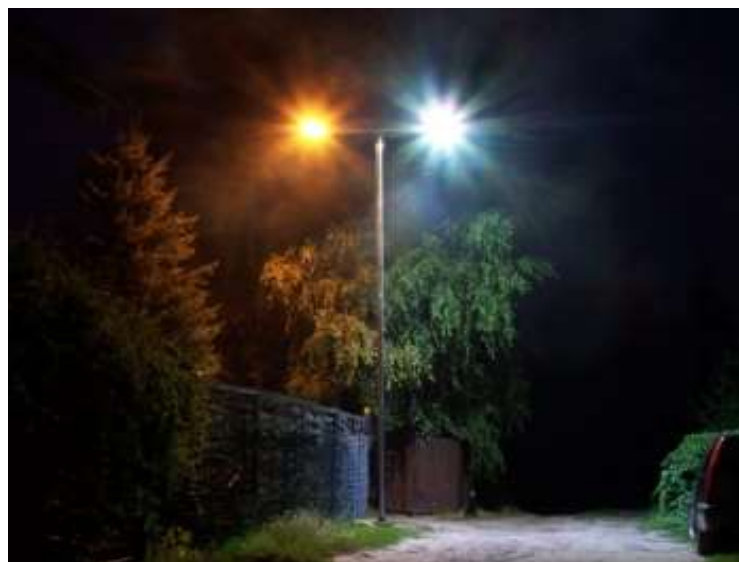
RYСУNEK 3 FOTOGRAFIA PRZEDSTAWIAJĄCA OŚWIETLENIE ŹRÓDŁEM SODOWYM (LEWA STRONA, MOC 75 W) I OŚWIETLENIEM TYPU LED (PRAWA STRONA, MOC 30W),

Porównanie tych dwóch głównych technologii pokazuje w rzeczywistości fotografia zamieszczona poniżej